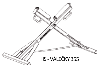
HS - VÁLEČKY 355