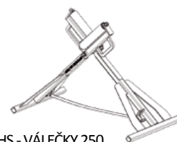
HS - VÁLEČKY 250

VÁLEČKY HIGH STAND jsou určeny pro podepření svařovaných trubek, zatímco probíhá svařování natupo. Válečky snižují tření trubky a potřebnou tažnou sílu na minimum bez ohledu na podmínky na staveništi. Válečky HS jsou speciálně navrženy pro řadu All Terrain a Trailer.