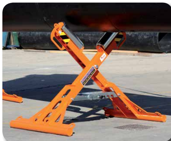
HS - VÁLEČKY 1000