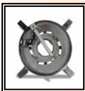
Přípravek na krátké lemové nákružky