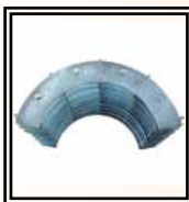
Čelisti Ø 200 ÷ 450 mm