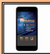
Aplikace "Set & Go Pro"

a: čelisti Ø 8" ÷ 18" IPS; 8" ÷ 18" DIPS, tepelně izolační obal do stojanu na topné zrcadlo, dřevěná bedna nebo kovová klec na hydraulické saně / vozík - hydraulickou jednotku / topné zrcadlo / hoblík