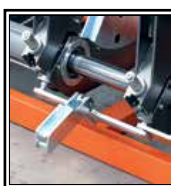
Odejmutelné zařízení pro topné zrcadlo