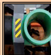
Horní čelist k upnutí kolen/T- kusů