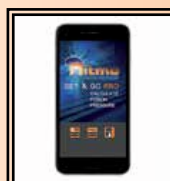
Applikace "Set & Go Pro"