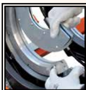
Čelisti Ø 75 ÷ 225 mm