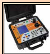
INSPEKTOR záznamové zařízení