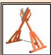
válečky HS 250