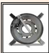
Přípravek na krátké lemové nákrůžky