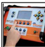
Ovládací panel s GPS