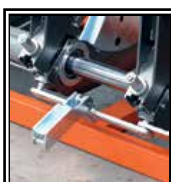
Odtrhovač topného zrcadla