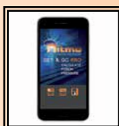
Aplikace "Set & Go Pro"