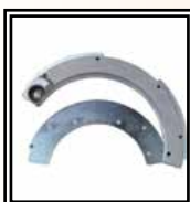
Čelisti Ø 75 ÷ 225 mm